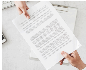
プレゼンテーション資料 + 「特典サービス」