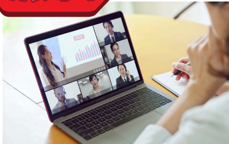
儲かるビジネスモデル構築 方法 7 STEPのセミナー動画